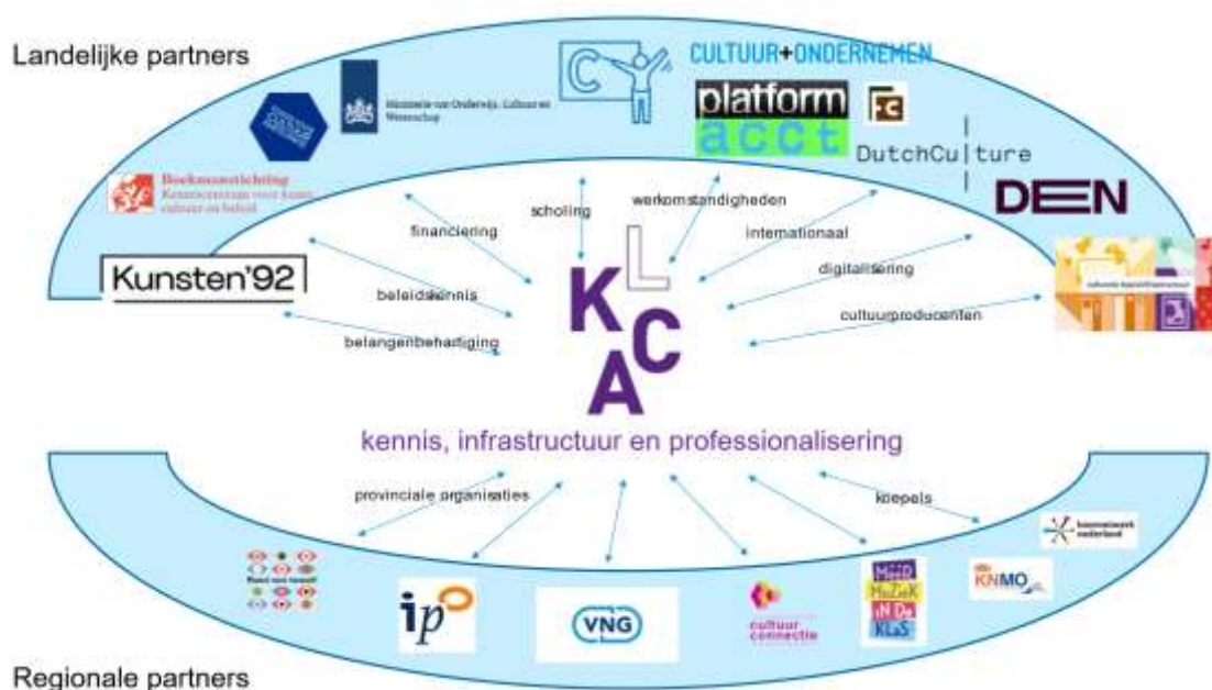
Afbeelding 1. Positie van LKCA binnen het werkveld

Daarnaast verstrekt het ministerie van OCW via de rijkscultuurfondsen financiële middelen aan de culturele sector. De bovensectorale instellingen adviseren en begeleiden daarbij organisaties in het veld en zorgen voor kennisdeling. LKCA vervult deze unieke rol voor het werkveld van cultuureducatie en amateurkunst.